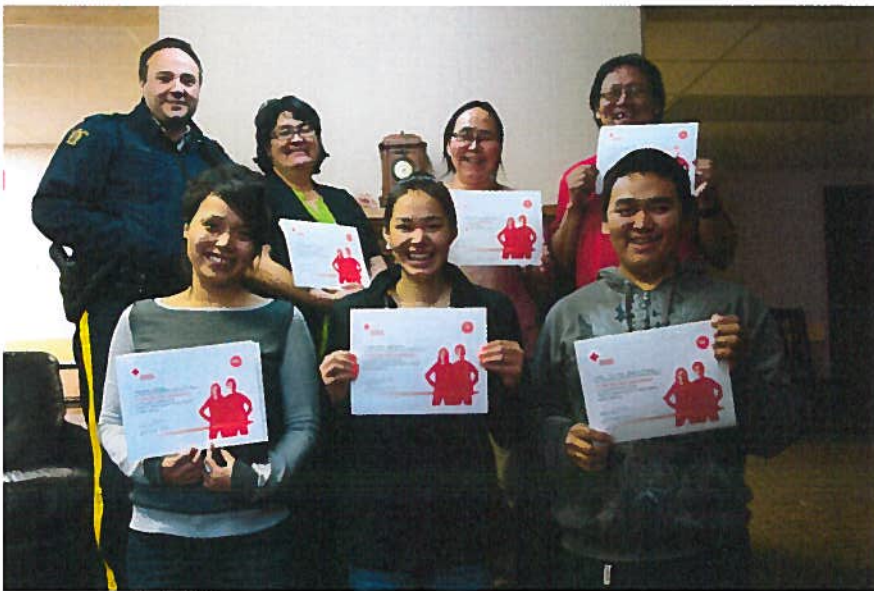
Ilihaktut tatvani Saptaiqa 2013-mi Pitiaknikut Illihaihimangmata Kamanikjuami.