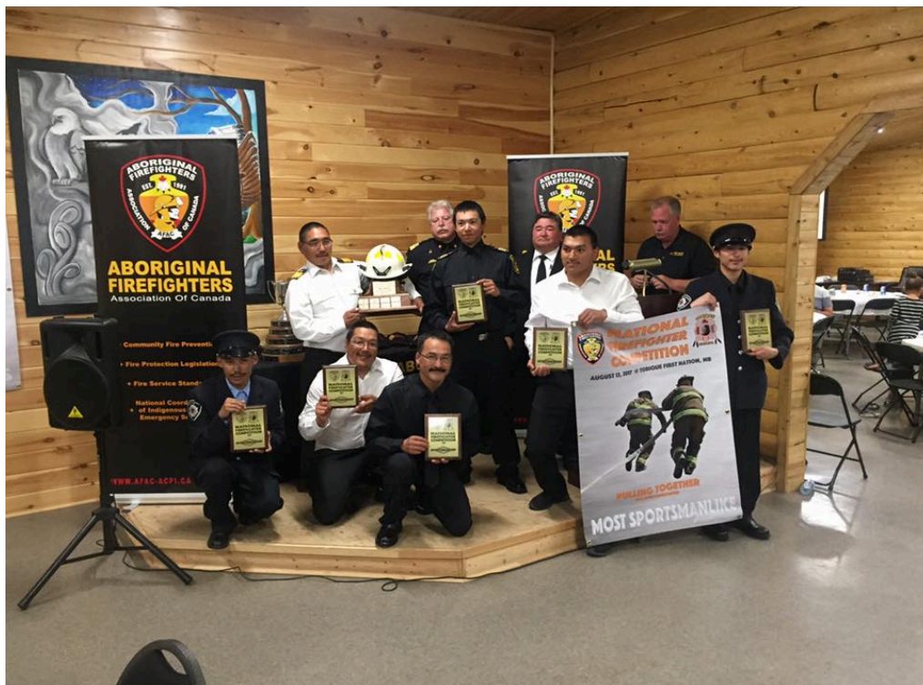
Havaqatigiiktut Nunavunmi uvani Nunarjuami Nunaqaaqqaqtut Qaptirijiit Akiraqtuutijut