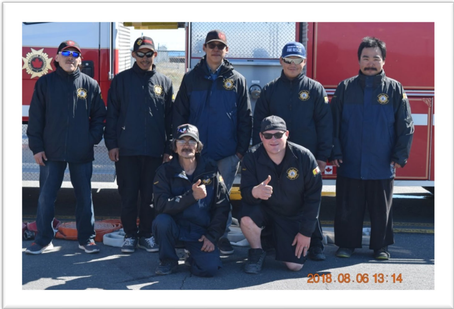
ካፕታይን ለባላኒ ለዎትታ - ለኅድረ ሊል (ዞኒኖ), ከልሩ ን (ኮኖኤራሙ)

ዞህኤጋልሙኑብላሩሲኑርኤገረሙ ከፈርረገር ርዕህብህ ላሊ ነዞኑርጋኑርብሩ ልክሙኑኤገረኤ ልረብሎሙኑኑገር ሙዎ ልጋላሙ ኑኑብሊኑሙ.