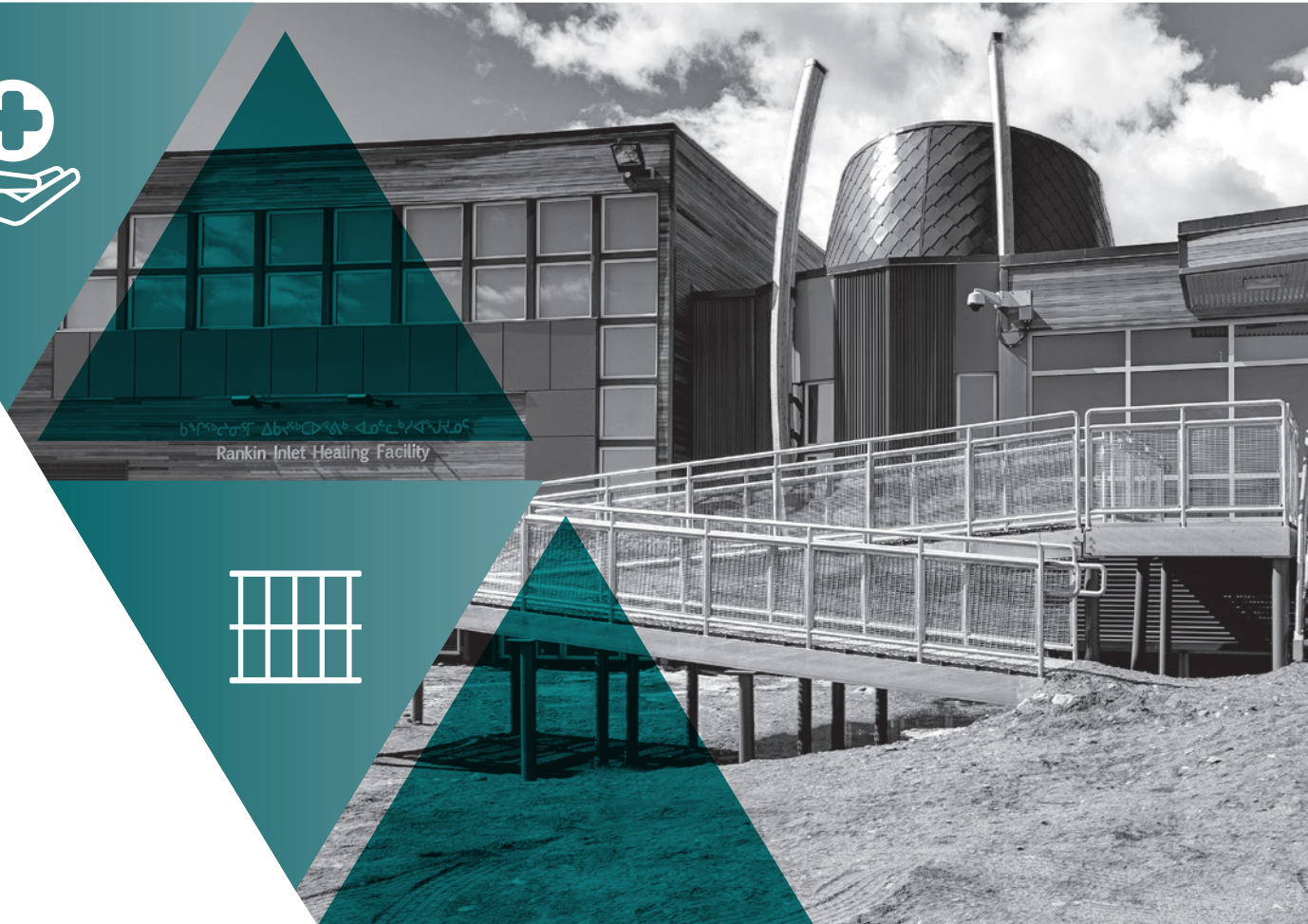
ᑲᑭᑭᑦᑲᑦ ᐃᑲᑦᑲᑦ ᐃᑲᑦᑲᑦ ᐃᑲᑦᑲᑦ Rankin Inlet Healing Facility